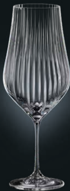
40.894.550.Op A: 240 mm D: 98 mm